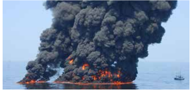
Şekil 2 a ve b: Denizlerde meydana gelen büyük petrol tankeri/üretim platformu yangınlarından örnekler

Tanker kazası sonucunda sızan petrolün %16'sı suya, %15'i ise buharlaşarak atmosfere karışır. %22'si biyolojik olarak çözünür, %3'ü açık denizde toplu olarak kalır, %16'sı kıyıya vururken, %28'i su dibine çöker. Tanker ve boru hatları ile taşınan petrolün sızması, rafineri ve tanker kazaları sonucu meydana gelen bu tür kirlenmenin boyutu, genellikle petrol ile kaplanan alanların büyüklüğü ile değerlendirilmektedir. Petrol ve türevlerinin yoğunluğunun, deniz suyu yoğunluğundan ortalama % 10 daha az olması nedeniyle, su yüzeyinde kalan maddeler, sahile ulaşmaya kadar bu konumlarını koruyamamaktadır.